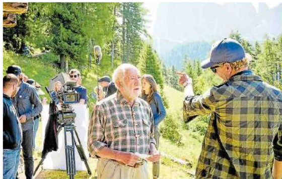
Für ein Filmprojekt dreht die Evangelische Jugend vor einigen Jahren mit dem prominenten Multitalent Dieter Hallervorden in Ortese in Südtirol.

Die Filmcrew trifft sich künftig jeden ersten und dritten Donnerstag