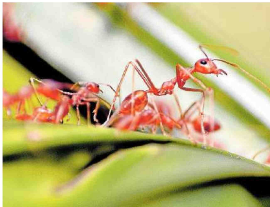
Wie leben Ameisen? Und was verbindet sie mit den Menschen? Um Fragen wie diese geht es beim Theaterworkshop im Harzwaldhaus.

Der Workshop am 11. April dauert von 10 bis 13 Uhr. Die Teilnahme ist dank einer Förderung der Bad-Harzburg-Stiftung kostenlos. Eine verbindliche Anmeldung ist aufgrund der begrenzten Platzzahl im Harzwaldhaus jedoch notwendig, möglich unter der Telefonnummer (0 53 22) 78 43 37 oder per E-Mail unter HarzWaldHaus@NLF.Niedersachsen.de . Interessierte werden gebeten, bei Anmeldung ihre Telefonnummer mit anzugeben. red