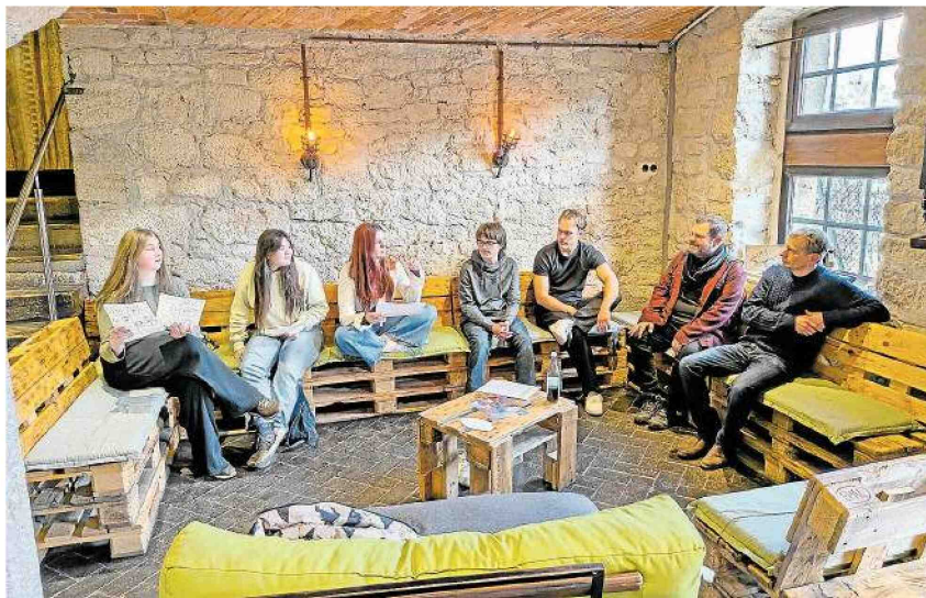
Drei Tage lang erarbeiten die Jugendlichen erste Inhalte ihres Films.